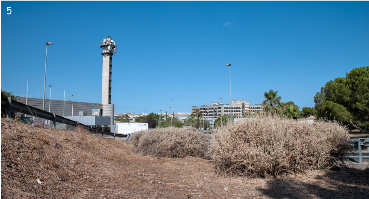
Fig. 5.- Aspecto de varios arbustos ornamentales de Atriplex halimus , gravemente afectados por el ataque de Monoxia obesula Blake, 1939. Población de Burjassot (Valencia), julio de 2017.