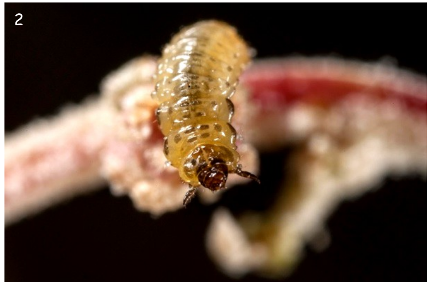
Fig. 2.- Larva de la población anterior, sobre tallo de Atriplex halimus.