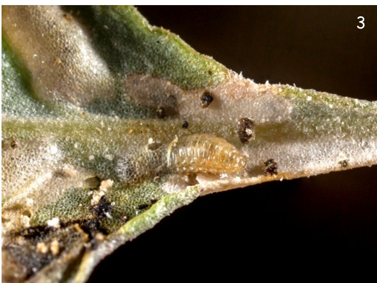
Fig. 3.- Larva ejecutando una de las minas foliares que caracterizan la presencia de esta especie.