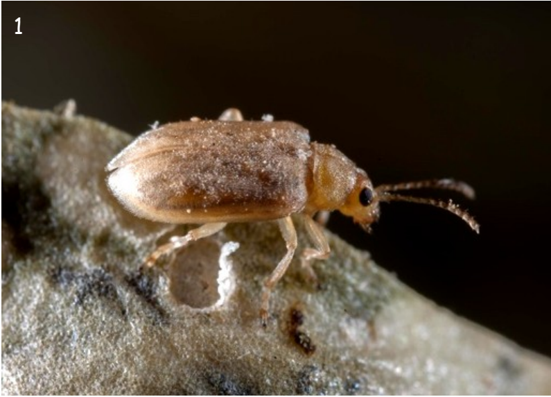
Fig. 1.- Ejemplar adulto de Monoxia obesula Blake, 1939, procedente de la población detectada en los Jardines del Turia, dentro de la ciudad de Valencia.