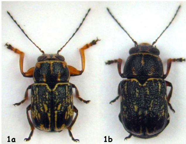
Fig. 1.- Habitus de P. alcantarensis sp. n.: a.- holotipo macho; b.- paratipo hembra.