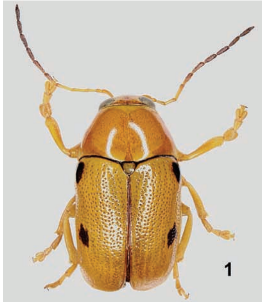
Fig. 1. – Habitus de Cryptocephalus danieli Clavareau.

1950; TEMPÈRE, 1971; COSTESSÈQUE, 2000), y recientemente incluso con un gran número de ejemplares (BOUYON, 2010), siempre sobre distintas especies de pinos, como Pinus sylvestris Linnaeus en Francia (COSTESSÈQUE, 2000; BOUYON, 2010) y P. pinaster (Aiton) en España (LENCINA GUTIÉRREZ et al. 2007).